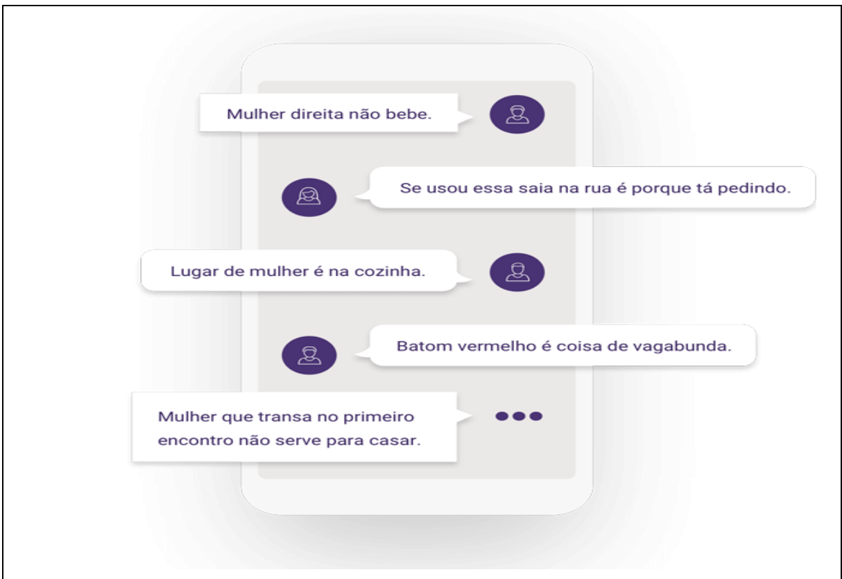
FIGURA 1 Expressões que banalizam e legitimam a cultura da violência e da discriminação contra a mulher na sociedade brasileira

[um enter de espaço de 1,5cm antes de iniciar o texto, espaço de 1,5cm entre linhas]